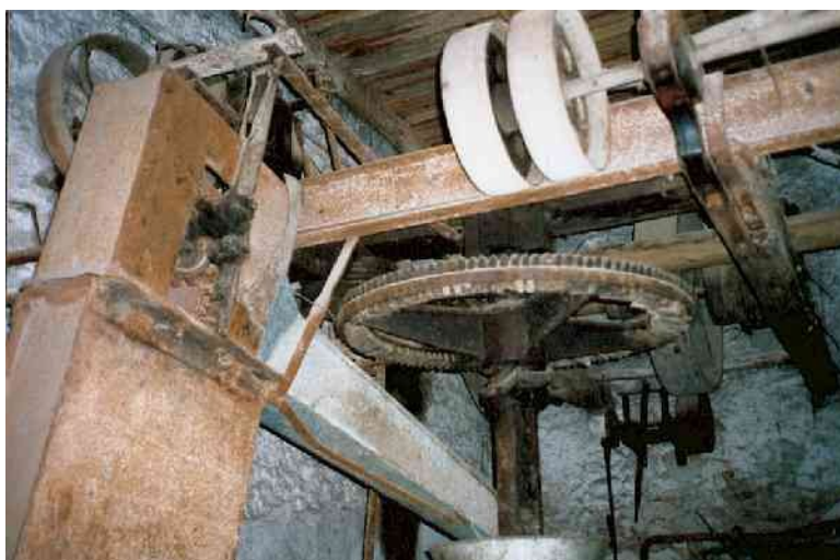
-Moulin Jean: palfer et rouet-