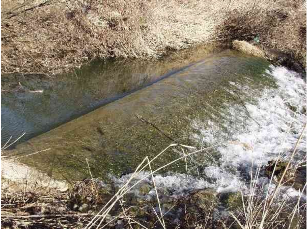
-La levée du moulin Jean-