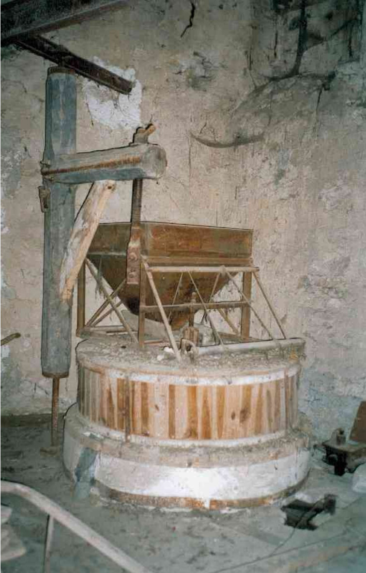
-Moulin Jean: la meule avec sa potence-